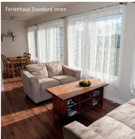
Ferienhaus Standard innen

Alle unsere Häuser sind mit Sat-TV und großen Flachbildschirmen, kostenlosem WLAN ausgestattet. Sie verfügen über ein Wohnzimmer mit Sitzzecke, eine Essecke, teilweise offene Wohnküchen aber auch separate Küchen. Die Küchen sind komplett ausgestattet mit Kaffeemaschine, Wasserkocher, Toaster, Mikrowelle, 4-Plattenherd und Backofen, Kühlschrank mit Gefrierfach, Besteck und Geschirr. Badezimmer mit DU/WC. Schlafzimmer mit Einzelbetten (keine Etagenbetten!). In Flateyri und auch in Sudureyri wurden Trockenräume für die nasse Angelbekleidung geschaffen und unseren Gästen stehen auf Wunsch in beiden Fischerdörfern Grills zu Verfügung um einen erfolgreichen Angeltag gemütlich ausklingen zu lassen.