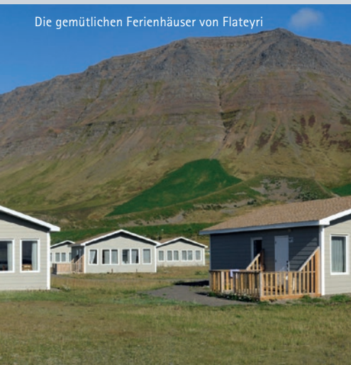
Die gemütlichen Ferienhäuser von Flateyri